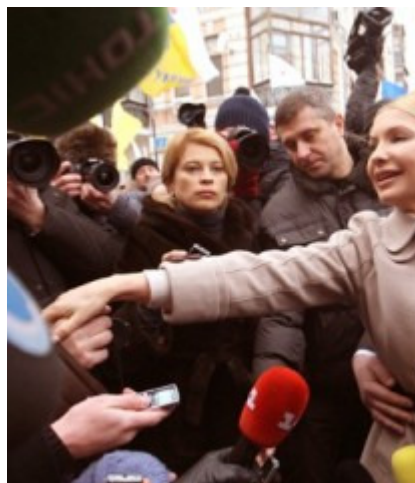
Как на работу. Регулярные походы Тимошенко в прокуратуру привлекают к ней постоянное внимание. Рейтингу власти это точно не помогает.

– А как получилось, что одновременно Дубина получал указания от Ющенко? 31